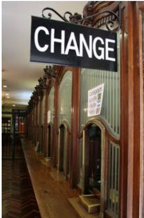
Imagen: Una oficina de cambio de divisas en Las Ramblas - Barcelona

No es necesario ser un trader para participar en el mercado de divisas: cada vez que viaje y necesite cambiar su moneda a una divisa extranjera, Vd. ya está participando en él.