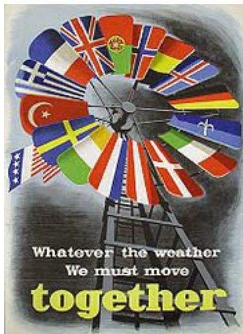
Imagen: El Plan Marshall.

Esta propuesta ciertamente visionaria para crear una poderosa unión de compensación para todos los países fue visto como algo negativo desde el punto de vista de EEUU.