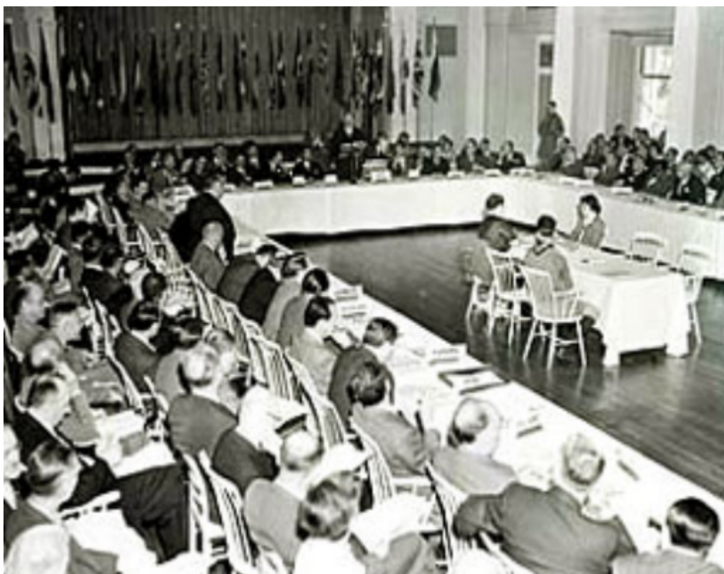
Fig. 2: La Conferencia de Bretton Woods.

Después de la 2ª Guerra Mundial el mundo necesitaba una moneda estable por lo que se alcanzó un acuerdo monetario en julio de 1944: setecientos treinta delegados de cuarenta cuatro naciones aliadas se reunieron en Bretton Woods (New Hampshire, EEUU). El motivo de la reunión era la Conferencia Financiera y Monetaria de las Naciones Unidas. Por primera vez en la historia de las relaciones monetarias entre los principales países industrializados del mundo eran reguladas; era la primera vez que se ponía en práctica un sistema en el que se negociaban y acordaban las reglas para las relaciones comerciales y financieras. El papel del dólar se formalizó en el marco del acuerdo monetario de Bretton Woods y otras naciones fijar sus tipos de cambio oficiales frente al dólar, mientras que EEUU se comprometió a intercambiar dólares por oro a un precio fijo bajo demanda de los bancos centrales.