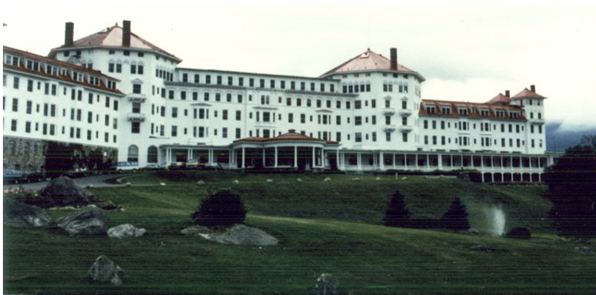
Imagen: Hotel Mount Washington, en Bretton Woods, New Hampshire, donde en 1944, se celebró la Conferencia Financiera y Monetaria de las Naciones Unidas, en la que se reunieron a representantes de 44 países.